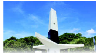
FAROL DO CABO BRANCO

João Pessoa, 05 de junho de 2024 * n° 0543 * Pág. 001/034