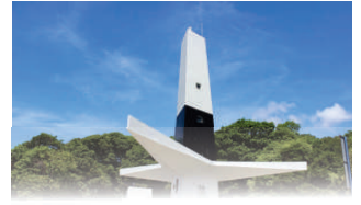
FAROL DO CABO BRANCO

João Pessoa, 23 de dezembro de 2024 * nº 0681 * Pág. 001/050